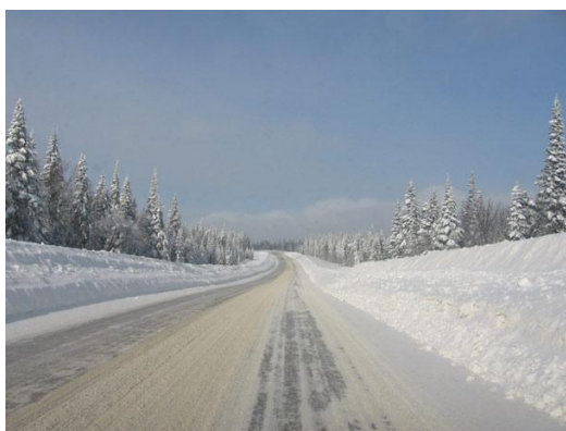
Route d'accès du sommet