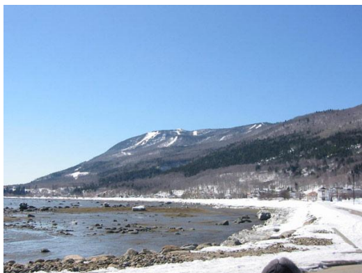
Littoral de la base