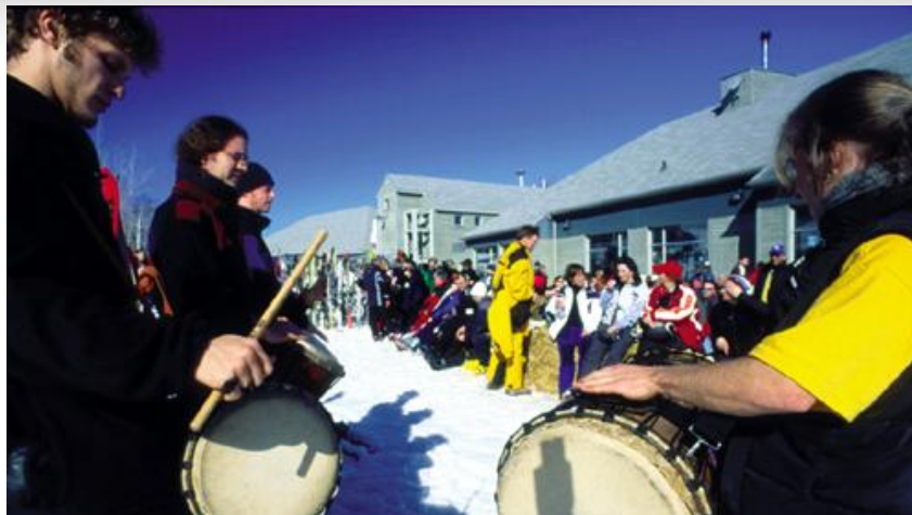
Chalet de la base (Capacité approximative: 1,500 personnes)

Bâtiment de 2 niveaux érigé en 1992. Sa façade sud offre une agréable vue sur le fleuve tandis que celle du nord est orientée vers les pentes. Ouvert sur une période d'environ 85 jours par saison. L'extérieur offre de nombreux points de vue intéressants, notamment au printemps lorsqu'aménagé d'un bar, d'un barbecue et de bottes de foin.