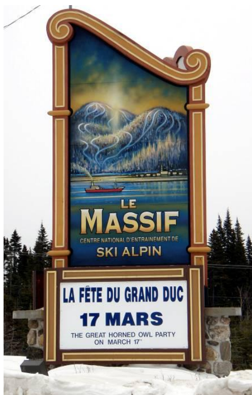
Accès route 138