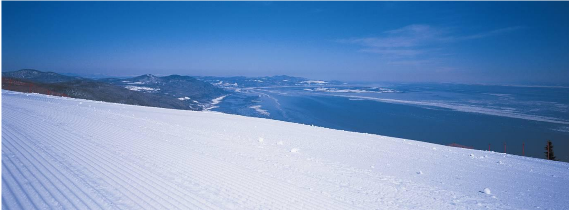
La Charlevoix ACCÈS C