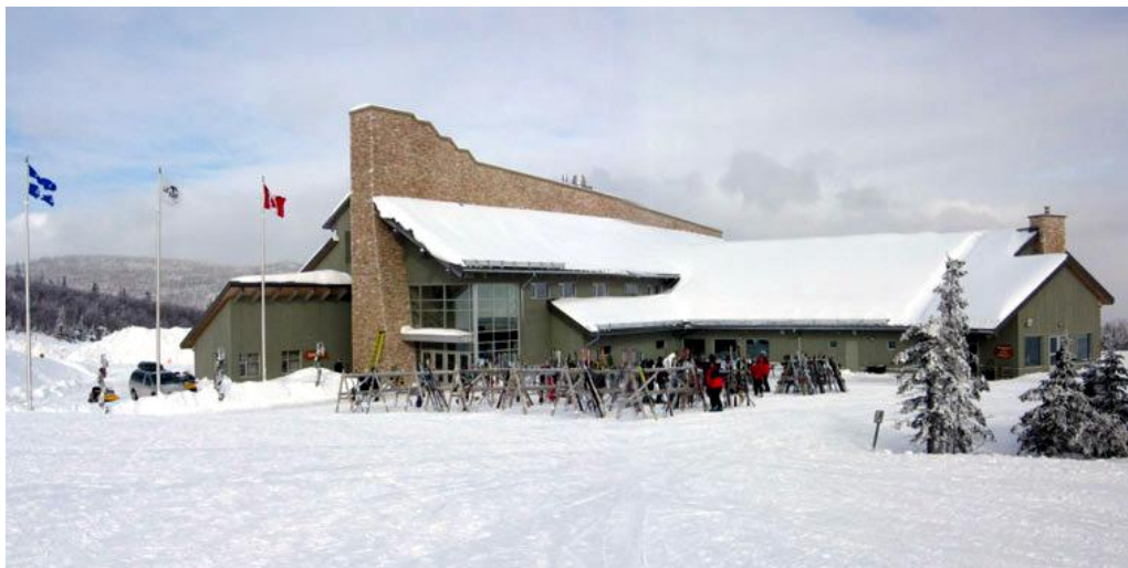
Chalet du sommet (Capacité approximative: 2,000 personnes)

Bâtiment de 3 niveaux érigé en 2001. Sa façade Est fait face au fleuve et est parée d'une fenestration mettant en valeur la beauté du paysage. Le chalet le plus prisé des visiteurs. Plusieurs lieux en extérieur permettent des points de vue intéressants et faciles d'accès.